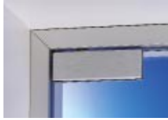
AT 44, Oberlichtbeschlag