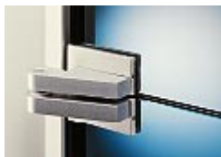
Türflügel mit feststehendem Oberlicht

Maßgefertigte Zargen von Deubl Alpha bestechen durch das leichte Profil und die ausgefeilte Technik. Alle Modelle sind kurzfristig lieferbar und eignen sich auch ausgezeichnet für den nachträglichen Einbau oder Umbau. Die fertige Anlage funktioniert wie eine gewohnte Drehtür. Zuhaltung und Schließung erfolgen über die Drückergarnitur. Wählen Sie zwischen Bundbart (BB), Zylinderschloss (PZ), WC-Riegel oder unverschließbar (UV).