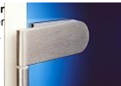
Dorma Studio Rondo

Dorma Türbänder Entsprechende Schlösser in der Galerie und hier .