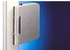
Dorma Junior Office