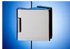
Dorma Junior Office Classic