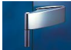
Dorma Arcos Studio