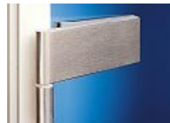
Dorma Studio Classic