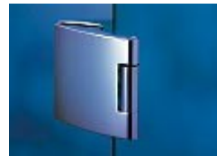
Dorma Arcos Office